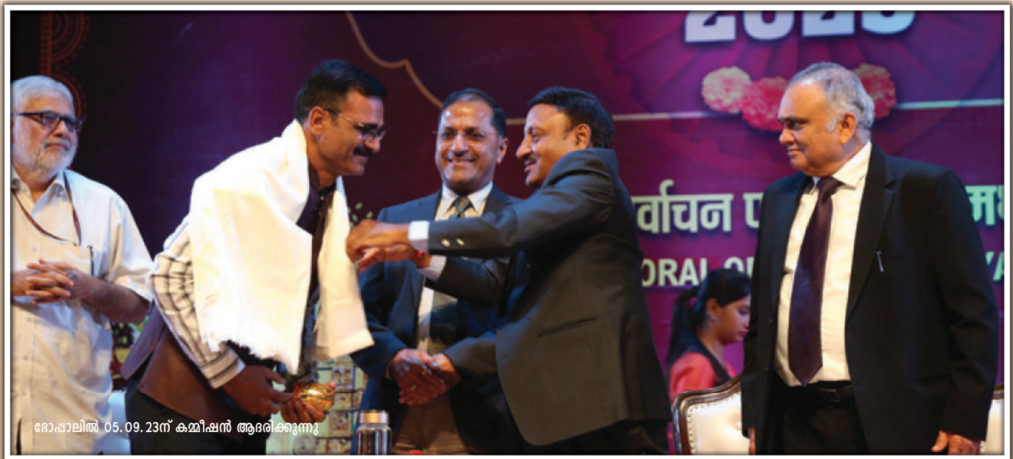
ഭോപ്പാലിൽ 05.09.23ന് കമ്മീഷൻ ആദരിക്കുന്നു

ബിഎൽഒ എന്ന നിലയിലുള്ള എന്റെ റോളിനെ ഞാൻ ലക്ഷ്യബോധത്തോടെയാണ് സമീപിക്കുന്നത്. എന്റെ ഉത്തരവാദിത്തങ്ങൾ സവിശേഷമായി നിർവഹിക്കാനാണ് ലക്ഷ്യമിടുന്നത്. എന്റെ നിയോജക മണ്ഡലത്തിലെ വോട്ടർമാരുമായി ക്രിയാത്മകമായി സംവദിച്ചുകൊണ്ട് അവരെ പ്രചോദിപ്പിക്കാൻ ഞാൻ പ്രതിജ്ഞാബദ്ധനാണ്. സംഗീതത്തോടും ആലാപനത്തോടുമുള്ള എന്റെ താൽപര്യം കണക്കിലെടുത്ത് വോട്ടർമാരെ പ്രധാന വിവരങ്ങൾ അറിയിക്കാൻ ഞാൻ സംഗീതത്തിന്റെ വഴി ഉപയോഗിക്കുന്നു. വോട്ടർമാരുമായി ഇടപഴകാൻ മാത്രമല്ല, അവരെ ബോധവൽക്കരിക്കാനുമുള്ള പാട്ടുകൾ ഞാൻ രചിക്കുകയും പാടുകയും ചെയ്യാറുണ്ട്. ഈ സമീപനം എന്റെ കർത്തവ്യങ്ങളുടെ വിജയത്തിന് കാര്യമായ സംഭാവന നൽകുകയും വോട്ടർമാർക്കിടയിൽ എന്റെ ജനപ്രീതി ഉയർത്തുകയും ചെയ്തു. ഗൃഹസന്ദർശന വേളയിൽ എന്നെ ബഹുമാനത്തോടെയും സഹകരണമനോഭാവത്തോടെയുമാണ് അവർ സ്വീകരിക്കുന്നത്. പുതിയ വോട്ടർമാരെ ചേർക്കൽ, മരിച്ച വ്യക്തികളുടെ പേരുകൾ നീക്കം ചെയ്യൽ, ഹാജരാകാത്ത വോട്ടർമാരുടെ വിവരങ്ങൾ പരിഷ്കരിക്കൽ എന്നിവ ഉൾപ്പെടുന്ന എന്റെ ബിഎൽഒ ഉത്തരവാദിത്തങ്ങൾ നിറവേറ്റുന്നതിന് എന്റെ വേറിട്ട സമീപനം എന്നെ സഹായിക്കുന്നു. ഈ പ്രോത്സാഹനകരമായ അന്തരീക്ഷം എന്റെ ബുത്തിലെ വോട്ടർ പട്ടിക കൃത്യവും പിശകുകളില്ലാതെയും നിലനിർത്താൻ എന്നെ പ്രാപ്തനാക്കുന്നു.