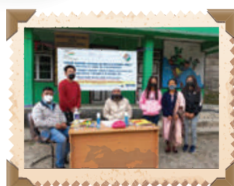
ബിഎൽജ നടത്തുന്ന പ്രവർത്തനങ്ങളുടെ ദൃശ്യങ്ങൾ

പ്രധാനപ്പെട്ടത്: സമഗ്രമായ നിലവാരമുള്ള വോട്ടർപട്ടികകൾ നിർമ്മിക്കുന്നതിനായി പുനപരിശോധനയ്ക്കു മുമ്പുള്ള പ്രവർത്തനങ്ങൾക്ക് തുല്യമായ പ്രാധാന്യം നൽകണം.