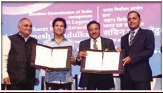
ഭാരതത്തിന് ശ്രീ സച്ചിൻ ടെണ്ടുൽക്കർ ബഹു. കമ്മീഷനുമായി ധാരണാപത്രം കൈമാറുന്നു