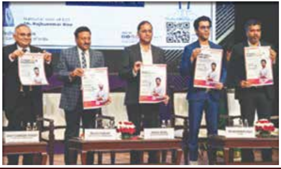
പ്രശസ്ത ബോളിവുഡ് താരം ശ്രീ രാജ് കുമാർ റാവു ബഹു. കമ്മീഷനുമായി ധാരണാപത്രം കൈമാറുന്നു